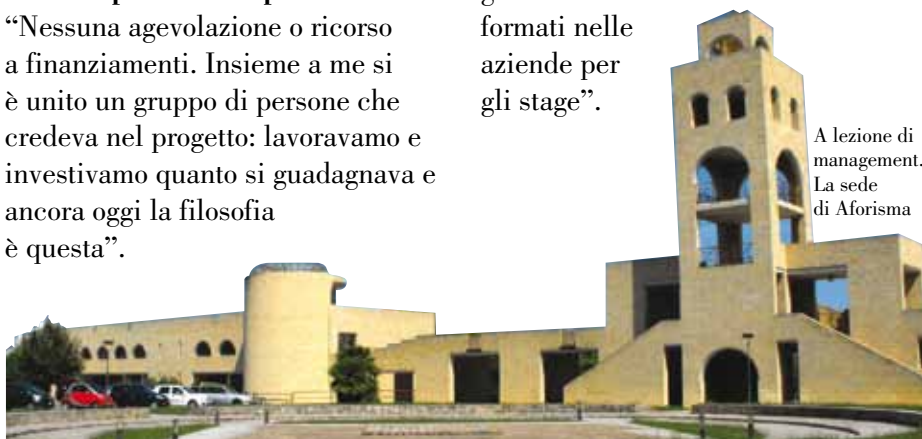
A lezione di management. La sede di Aforisma

"I tanti giovani che provengono da tutto il centro Sud che abbiamo formato nei master e messo in contatto con le grandi aziende del territorio nazionale con le quali oggi lavorano. Si è creato un bellissimo circolo virtuoso e ormai le persone formate dieci-15 anni fa sono manager che intervengono nelle nuove edizioni dei master o accolgono i nuovi formati nelle aziende per gli stage".