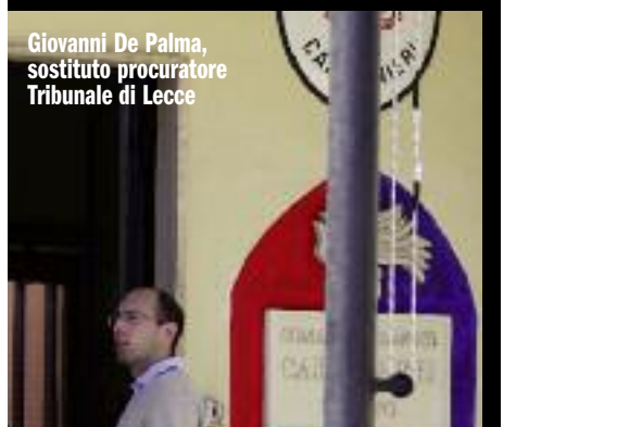
Giovanni De Palma, sostituto procuratore Tribunale di Lecce