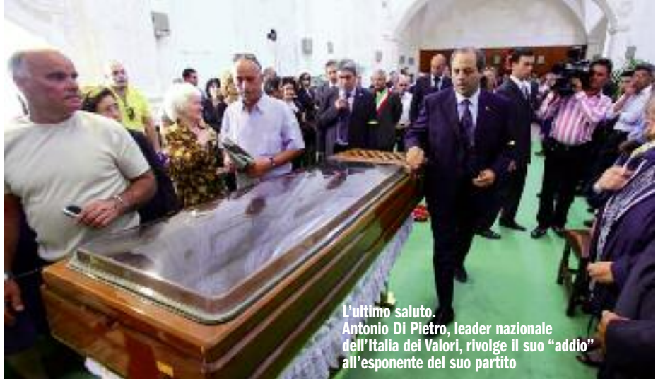
L'ultimo saluto. Antonio Di Pietro, leader nazionale dell'Italia dei Valori, rivolge il suo "addio" all'esponente del suo partito