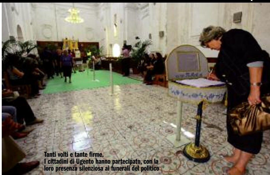
Tanti volti e tante firme. I cittadini di Ugento hanno partecipato, con la loro presenza silenziosa ai funerali del politico

ENTRA ANCHE TU NELLA COMMUNITY DEL TACCO D'ITALIA E DISCUTI DI QUESTO ARGOMENTO SU WWW.ILTACCODITALIA.NET